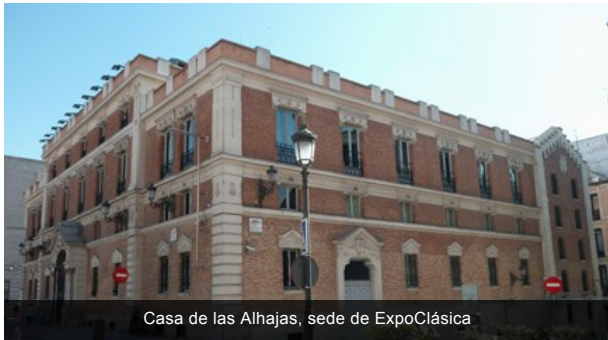
Casa de las Alhajas, sede de ExpoClásica

ExpoClásica es un encuentro profesional que congregará en Madrid, entre los días 22 y 24 de noviembre, al sector de la música clásica nacional, contando para ello con la asistencia de agencias y promotores nacionales e internacionales.